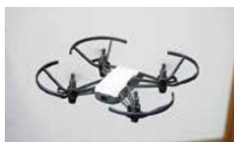
トイドローンで練習やDJI社の他の機体も体験可能