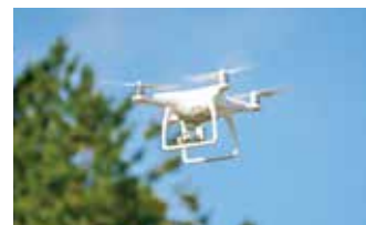
人気の機体で実技実習