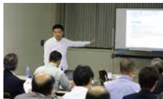
受講前のスクール無料説明会の様子