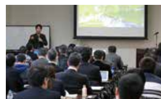
ドローンに関する講演会などイベントも開催!