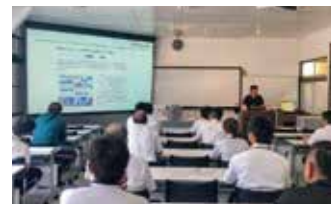
近隣施設にて座学を行います