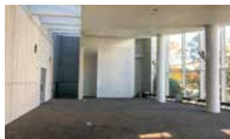
屋内練習場にて実技実習